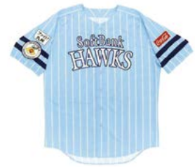
▲レプリカユニフォーム 見本