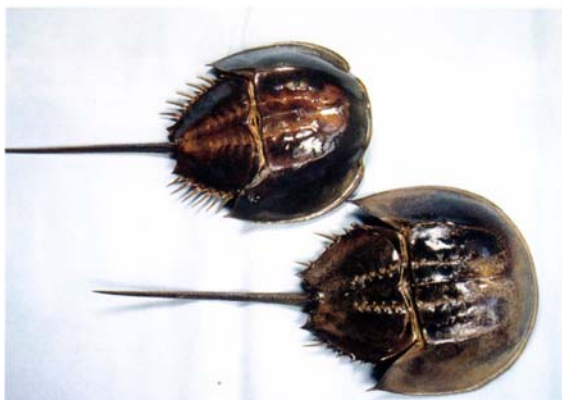
カブトガニの雄（写真上）、雌（写真下）

伊万里湾は日本でも有数のカブトガニの繁殖地として知られています。特に伊万里湾の奥の多々良海岸（伊万里市）は毎年延べ数百つがいのカブトガニが産卵にやってきました。産卵は、6月下旬から8月上旬の大潮の満潮時刻に行われます。雌の後ろに雄が「つがい」で産卵をします。カブトガニは、周囲の環境の変化に対応する抵抗力が強く2億年も前の姿を残している「生きている化石」といわれ、貴重な生物です。近年の海岸線の開発や水の汚れなどのためその数を大きく減らしています。カブトガニの保護には、産卵地である砂浜はもちろんのことふ化した幼生のくらす干潟、そして成体のくらす海域と、広い環境が必要です。この環境をいかに確保するかが大きな課題です。伊万里高校では、多々良海岸の清掃をはじめカブトガニの生態等について調査研究を行ってその保護に努めています。7月15日（土）には伊万里市カブトガニを守る会を中心に「第22回カブトガニの産卵を観る会」が多々良海岸で実施されます。松浦市では昭和52年志佐町浜新田がカブトガニの産卵地として確認されています。人間とカブトガニが共存できるような、美しい伊万里湾を次の世代の子どもたちにも残してあげたいものです。