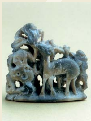
▲青玉製の雌雄鹿像

この2点は、壱岐市立一支国博物館で4月22日から6月19日まで開催されている「発掘ながさき至宝展」に貸し出し中です。