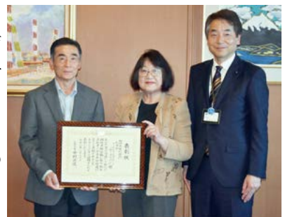
▲左から2番目、山口代表

山口代表は、2月14日に市役所を訪れ「今後は若いサポーターに加入してもらい、長く活動を続けたい」と受賞の喜びを話しました。