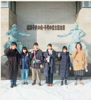
▲北海道福島町にて

1月10日から13日までの4日間、長野県木曾町と北海道福島町を市内中学校の生徒各2人が訪問しました。この事業は、同じ「福島」の名を持つ、両町と本市の生徒が相互に訪問し合い、気候・景観・歴史・生活文化等を見聞し、訪問先の人々との交流を深めることにより、広い視野と豊かな郷土愛を持つ青少年の育成を図ることを目的に実施しています。北海道福島町では、横綱記念館・青函トンネル記念館などの見学や函館でのスケート体験、長野県木曾町では、そば打ち体験やスキー体験を通して、両町生徒との交流を深めました。