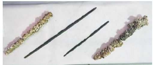
▲剣と見られる鉄製品