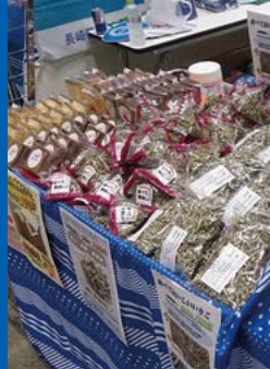
試食では「無添加」「手作り」など 安心・安全な食が人気。

参照 / 農林水産省 平成29年度 食育白書 (平成30年5月29日公表) より https://www.maff.go.jp/j/syokuiku/wpaper/h29/h29_h/book/part1/chap1/b1_c1_1_03.html