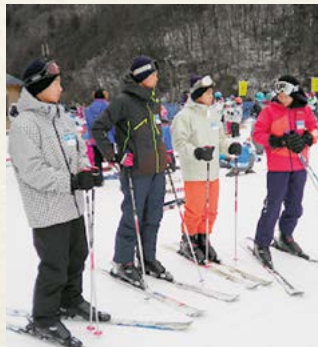
▲長野県木曾町にて