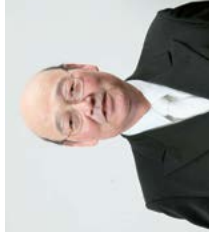
▶甲南大学特別客員 教授・名誉教授 田中修先生