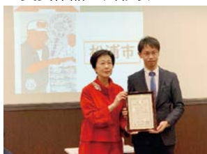
▲楓千里選考委員と記念撮影