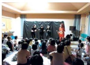
▲毎年恒例の真夏の夜のこわ～いおはなし会