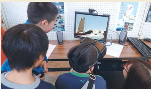
▲市制施行10周年記念式典 HMD体験の様子

国史跡鷹島神崎遺跡を含む鷹島海底遺跡は、世界的にも類を見ない水中考古学のフィールドです。しかしながら、海の底に存在しているため、誰もが目にする事ができません。松浦市では、「見えない」「行くことができない」この遺跡を身近に感じてもらえるよう、さらなる取り組みを進めていきます。