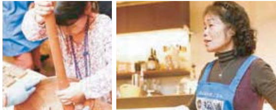
「新鮮な魚、塩、水でこんなに簡単に作ることができるなんて!」参加者もびっくり!

全員が魚をすり鉢で攪り、手で丸め、成形したかまぼこづくり体験は大盛況!アツアツ、出来立てをいただく試食タイムでは「ぶりぶり!感動!」「今まで食べてた蒲鉾はなんだったの!?!」といった感想も飛び出す展開に。今後も、マグロ(多彩な部位の食べ比べ)、ハーブ鯖(寿司体験)と、松浦・青島の幸を題材にしたワークショップはまだまだ続きます。