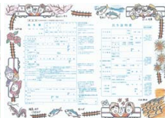
▲ 出生届 優秀賞作品