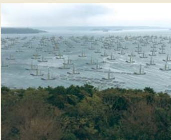
▲ 星鹿城山からの元寇船団の様子