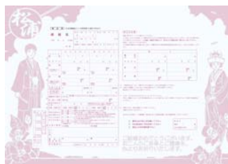
▲ 婚姻届 優秀賞作品