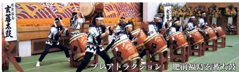
肥前福島玄蕃太鼓 プレアトラクション