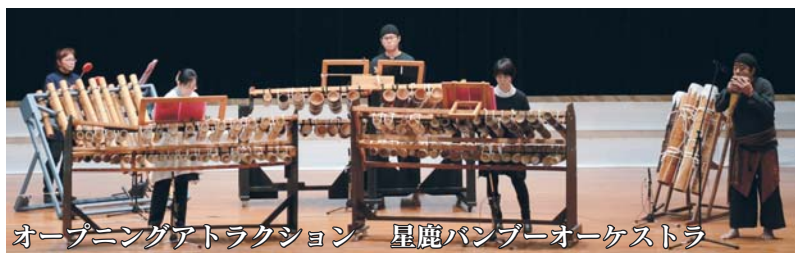
星鹿パンプーオーケストラ オープニングアトラクション