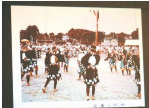
島踊り継承映像化委員会による記録映像上映の様子

島踊り継承映像化委員会による記録映像上映が行われました。鷹島町で行われてきた「島踊り」を映像化し、そのしきたりや伝承を市民の皆さんに知っていただき、松浦市に息づく伝統としての「島踊り」により親しんでほしいとの思いで制作されました。