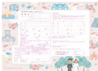
▲ 婚姻届 最優秀賞作品