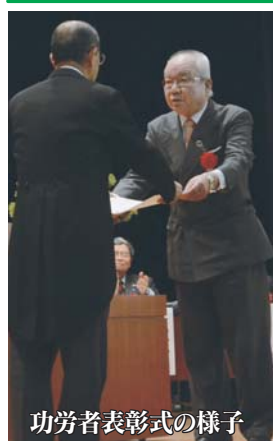
功労者表彰式の様子