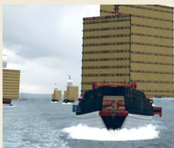
▲ フェリー上から元寇船の船団を突き進む様子

ほかにも、市内文化財の案内マップなど多くの機能を持っています。アプリのダウンロードは無料です。「App Store」「Google play」からダウンロードしていただき、迫力ある元寇船を体験ください。検索は「元寇」です。