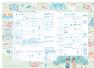
▲ 出生届 最優秀賞作品