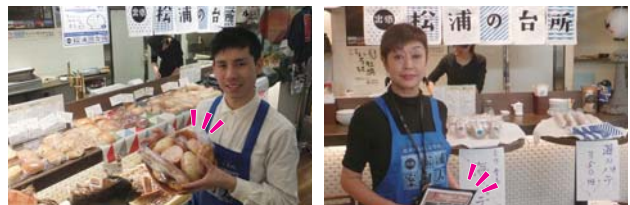
毎週木曜ランチタイムは「松浦の台所」 松浦の観光案内も開催中！