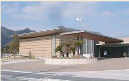
▲ たつの市立埋蔵文化財センター外観