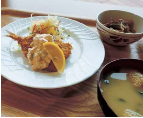
▲県庁の食堂で提供された松浦アジフライ定食