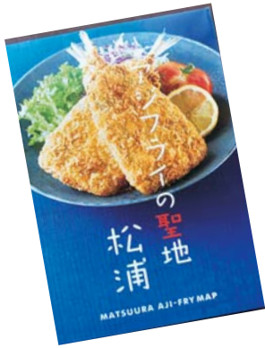
▲第1弾アジフライマップ

日本一の「アジフライ」を、これまで以上に広くたくさんの人に味わってもらいたい、松浦の「アジフライ」を日本中の人に知ってもらいたい、そんな思いから、アジフライマップの作成に着手しました。