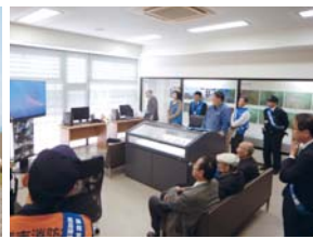
▲パトロール隊出発の様子