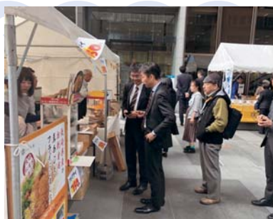
◀揚げたてアジフライ販売ブース