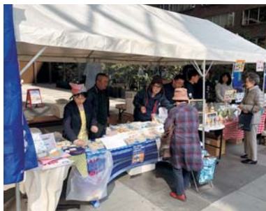
農水産物販売ブース▶

3月20日、福岡市天神の福岡銀行本店中庭で「松浦フェア in 福岡」を初開催。松浦の食・観光・特産品をPRし、認知度を高めるとともに市内事業者様の販路拡大につなげるきっかけづくりの場として、松浦から多くの事業者様にも参加していただきました。