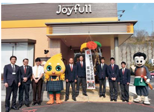
▲アジフライ定食発表セレモニーの様子

メニュー提供に際して行われたレモニーには、関係者が多数参加。地元の高校生とのコラボメニューということもあり、テレビ、新聞等でも取り上げられました。