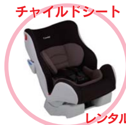
チャイルドシート