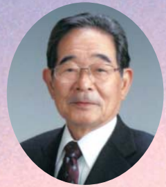
松浦市議会議員長