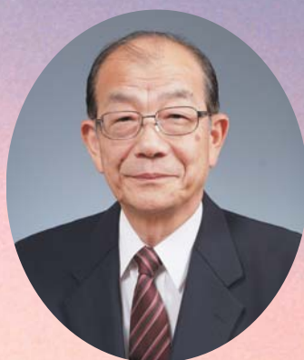
松浦市長 友広 郁洋