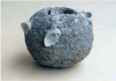
▲ ベトナム国立歴史博物館で展示される「てつほう」

この第5章で、わが松浦市の鷹島海底遺跡から出土した「てつほう」2個、石弾2個、鉄製甕1口、陶磁器3個、碇石1組が展示されます。鷹島海底遺跡の遺物が海外で展示されることは初めてであり、これらの遺物を通して国際親善と水中遺跡に対する理解を深めていただければと思います。