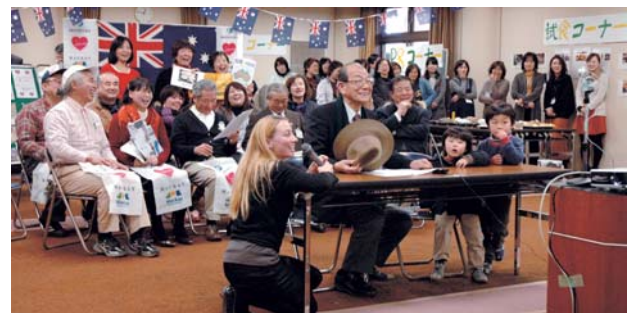
▲ 第1回オーストラリア・デーの様子