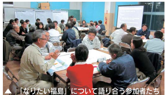
▲ 「なりたい福島」について語り合う参加者たち