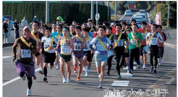
昨年(2013年)の大会の様子