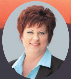
オーストラリア・マッカビー市長

結びに、新しい年が市民皆さまと松浦市にとりまして実り多き一年となりますことを心から祈念いたしまして、年頭のごあいさついたします。