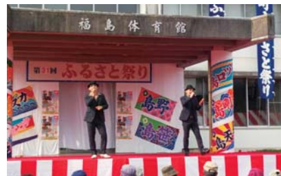
COOLな歌声で松浦を元気に!

福岡天神で松浦シティプロモーションに奔走する私たちですから、当然、PRの舞台は福岡都市圏です。しかし、今秋からその舞台がいよいよ松浦へ向かいはじめました。福岡でトップクラスのシェフ軍団「ミラベル21」、その幹部シェフたちが11月8・9日、一泊二日で御厨・青島など現地視察ツアーを実施。松浦食材研究をスタートしました。