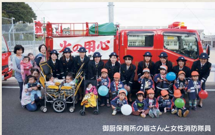
御厨保育所の皆さんと女性消防隊員