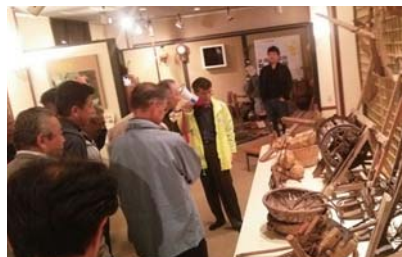
食と歴史の松浦ツアーに参加者感動!