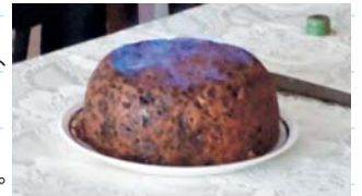
▲ クリスマスケーキ