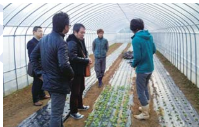
福岡シェフの松浦食材研究スタート!