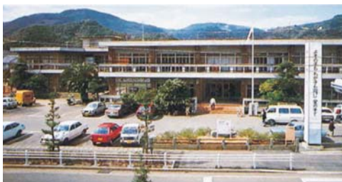
▲ 旧図書館が入っていた松浦市民会館 (『1982松浦市勢要覧』p.17)

*旧松浦市のあゆみを知りたい、過去の風景写真を探したい場合は、「市報」や「市勢要覧」をご利用ください。館内2階の「地域・行政コーナー」で提供しています。