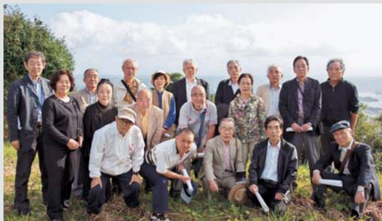
▲ 松浦を訪れた東京・松浦ふるさと会の皆さん

三日目は、松浦党梶谷城跡、松浦水軍まつりなどを見学。会員の皆さんは、松浦の歴史をあらためて知り、松浦めぐりの旅を満喫していました。