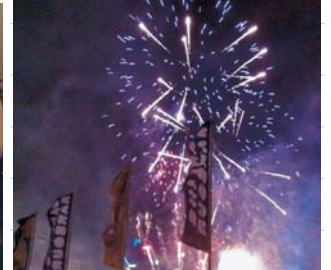
▲ オーストラリアのクリスマス ▲ シドニーのカウントダウン