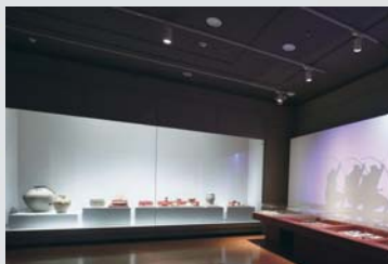
◀ 済州博物館での展示の様子

鷹島海底遺跡から出土した遺物は、国内外の博物館から注目されており、貸し出しの要望を多数受けています。他の博物館に展示されることによって、鷹島海底遺跡はもとより、長崎県松浦市の魅力を広く発信していけるようこれからも取り組みを進めてまいります。