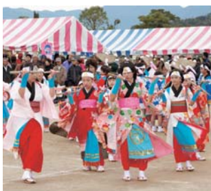
▲前回の披露の様子

土谷浮立と同様に夏休み期間中に稽古が行われ、地区住民らにより保存・伝承の取り組みが行われています。