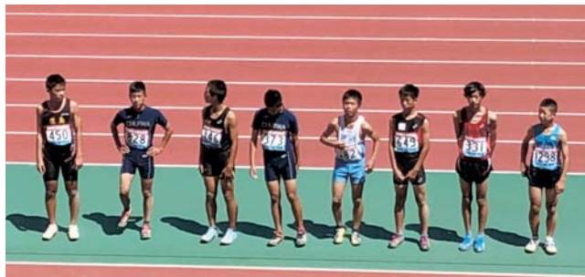
▲男子走幅跳の競技中の様子