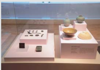
▶ 羅州博物館での展示の様子