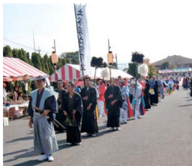
▲前回の披露の様子

す。太鼓中心の演舞で、古式ゆかしい太鼓の所作に特徴があり、二列縦隊で笛の音頭とお先払いの誘導で進みます。 毎年夏休み期間中に、全体稽古が行われ、今も伝統が受け継がれています。 地区住民らの熱意と努力により、大切に保存、継承されてきた郷土芸能をこの機会にぜひご覧ください。