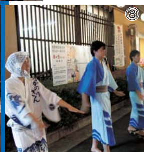
⑦・⑧ 木曾踊り参加の様子