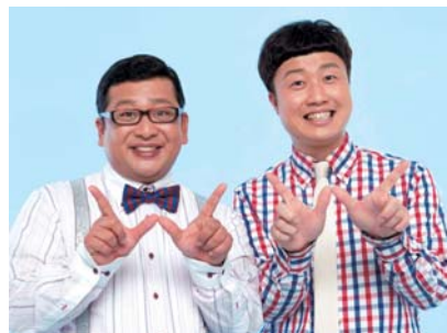
▲ W エンジン