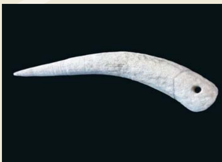
▲鷹島歴史民俗資料館で展示中