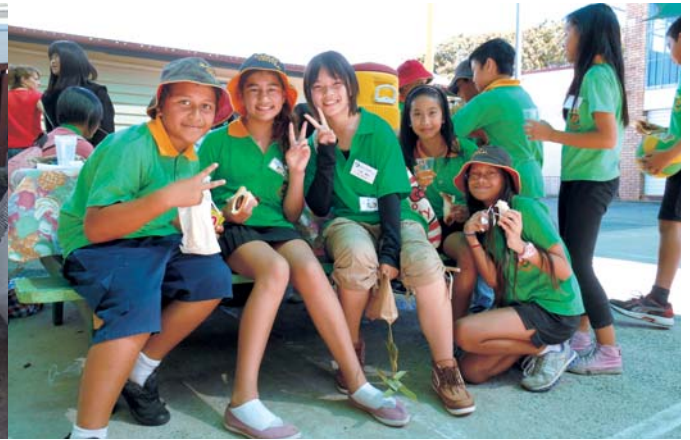
▲ セントラル小学校訪問