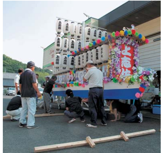
▲上志佐地区の精霊船作りの様子

活動開始からはや9年、時代とともに変化を遂げたこの精霊流しも、着実に地域の人々に愛され大切な「景観」になっています。