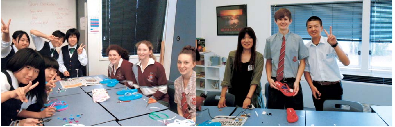
▲ ウィットサンデー・アングリカンスクール訪問 ▲