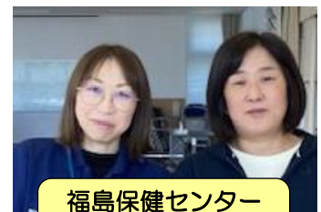
福島保健センター (福島・鷹島担当)