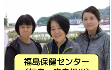
福島保健センター (福島・鷹島担当)

保健師・看護師・介護支援専門員などのスタッフが すこやか青プラザ1階窓口でお待ちしています！