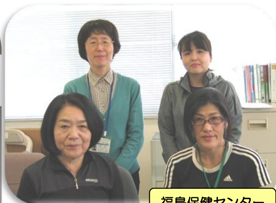
福島保健センター

保健師・看護師・介護支援専門員などの スタッフが市役所1階⑦番窓口でお待 ちしています！