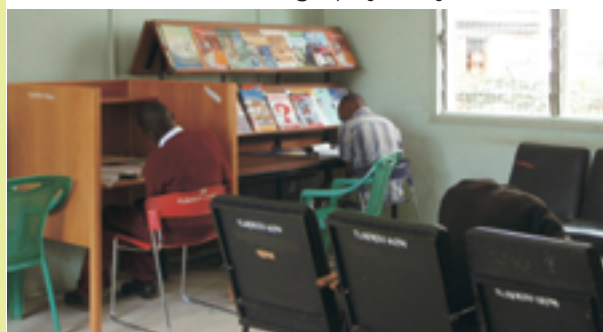
▲図書館内。新聞を読む利用者、机に向かう利用者とも Secondary の学生です。将来のタンザニアを担う彼らの表情はいつも真剣です。

くは教科書や参考書。残念ながら図書館でも数に限りがあるため館外への貸出はできず、そのため開館から閉館まで本に噛付いて勉強する子も珍しくありません。読書=勉強と考えるためか、小説の利用は殆どありません。読書は勉強のため。ですから、小説を楽しむという発想がないようです。人気が高いのは Geography、Physics です。