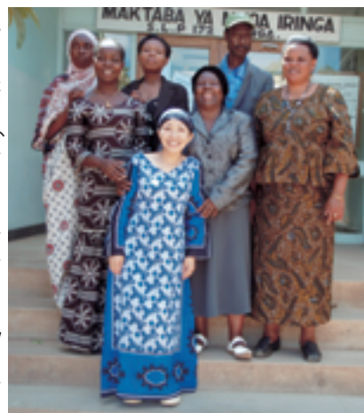
▲図書館前で同館スタッフと撮影。写真を1枚撮るのも大騒ぎ。何度も挑戦し、まっすぐ撮ってもらえたのはこの1枚だけでした。