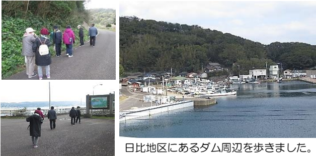
日比地区にあるダム周辺を歩きました。