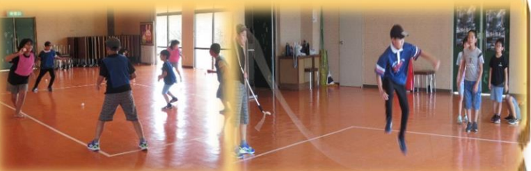
9月12日(木) 子どもニュースポーツ教室