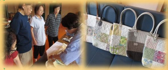
マチ付きのかわいいパッチワークバックが完成しました🎉