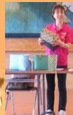
持ち手の変わったPPバンドのかごバックに挑戦しています。完成が楽しみです♪