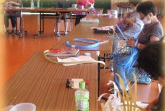
9月13日(金) 手づくり教室 (PPバンドのバック)