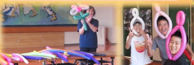
9月19日(木) のびのび子ども教室 (バルーンアート)

「ケンちゃん倶楽部」より講師を迎え、「バルーンアート」を教えてくださいました。初めは慣れない手つきで割れないかと子ども達は恐る恐る扱っていましたが、徐々に慣れてくるとねじり方が上手になり、かわいいバルーンアート(ロケット・剣・花)を作り上げました🎉