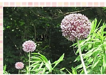
さわやかウォーキング