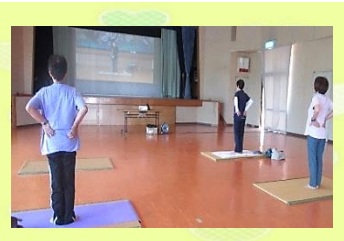
リフレッシュ・コンディショニング