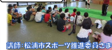
講師：松浦市スポーツ推進委員さま

ボッチャ・モルック・ラダーゲッターの3種目に挑戦しました。どの種目も最後まで勝敗の行方が分からず、大盛り上がりでした。