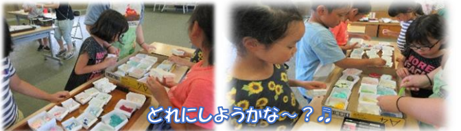
どれにしようかな？

1～3年生対象の工作教室(^_^)楽しんで好みの材料を選び、世界に1つだけのフォトフレームが出来ました。慎重に貼り付けて、乾かして、次の飾りを選んで...、終わりのない創作意欲に大人もびっくり！どんな思い出の写真が飾られるのかな？お家で大切に使って下さいね♪