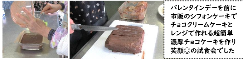
バレンタインデーを前に市販のシフォンケーキでチョコクリームケーキとレンジで作れる超簡単濃厚チョコケーキを作り笑顔の試食会でした