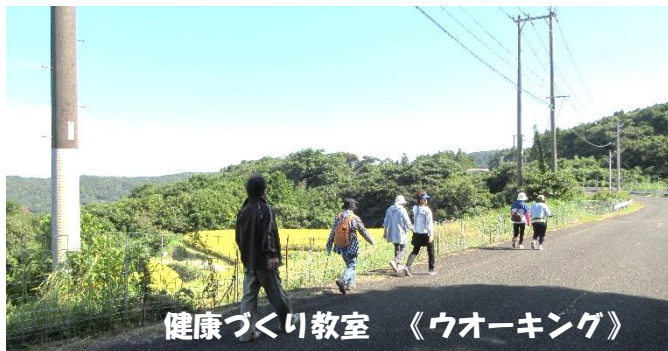
健康づくり教室 《ウォーキング》