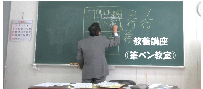
教養講座 (筆ペン教室)