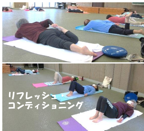
リフレッシュ コンディショニング

今回は上志佐を離れ調川町中免から平尾免の山間の市道を歩きました。伊万里湾は少し霞んでいましたが、澄みきった秋空の下でのウォーキングを気持ち良く出来ました。