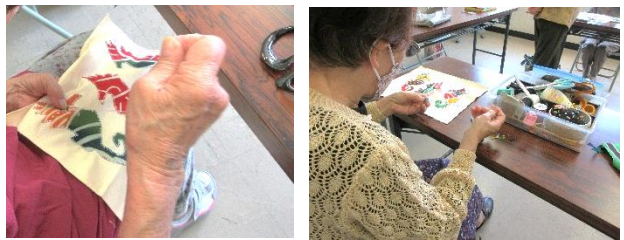
(干支のミニフレーム)