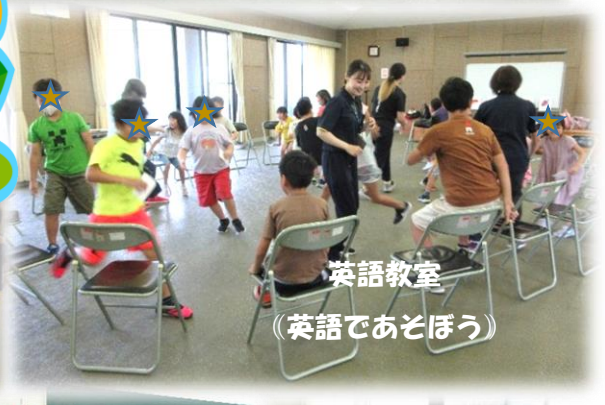
英語教室 (英語であそぼう)