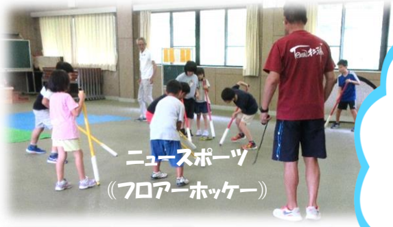
ニュースポーツ (フロアーホッケー)