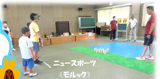
ニュースポーツ (モルック)