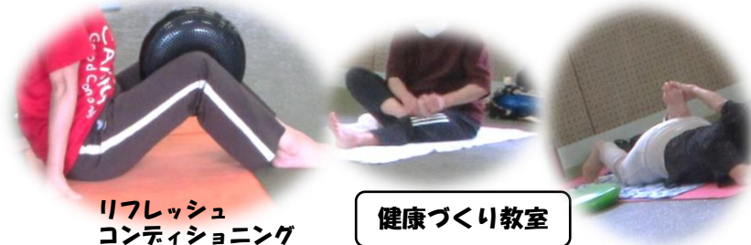
リフレッシュ コンディショニング

ポッチャは赤のボールと青のボールの2チームに分かれ、いかに白色のジャックボールの近くに投げられるかを競うスポーツです。今回、赤青共に同距離にあたりして審判(スポーツ推進委員)を悩ませたりしましたが、楽しい時間でした。とても簡単で面白いので沢山の人が参加していただき良かったです。