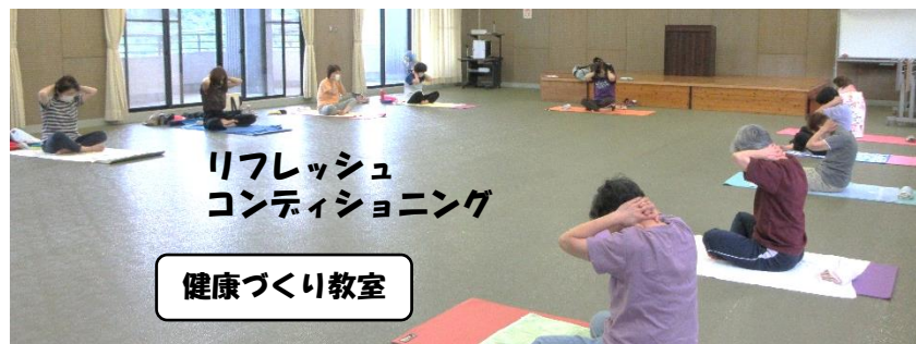
リフレッシュ コンディショニング

今回は、予定していたメニューが時期的に材料の調達が難しかったため変更し、時季に合わせた野菜たっぷりの サラダソーメン 2種、市販品を利用して、ひと工夫を加えた簡単な マーボーじゃが 、サッパリとしたカルピス味の プリン を作りました。