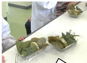
2年生 ちまき・団子作り