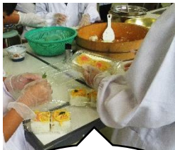
3年生 押し寿司作り