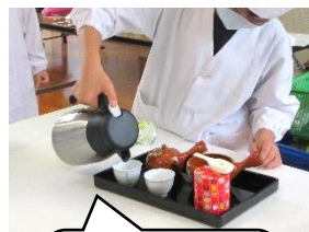
4年生 お茶の入れ方