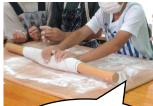
5年生 そば打ち体験