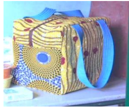
見本は公民館にあります