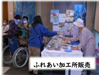
ふれあい加工所販売

11月1日(土)、2日(日)の2日間「今福町民文化祭」を開催しました。久しぶりのバザー(物品販売)も行いたくさんの方々にお越しいただきました。文化祭の開催にあたりご協力、ご来場いただきました皆様に深く感謝申し上げます。