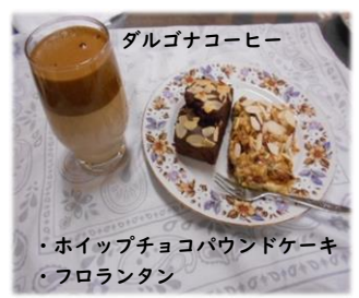
ダルゴナコーヒー