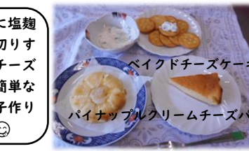
バイクドチーズケーキ パイナップルクリームチーズパイ

無糖ヨーグルトに塩麹を入れて混ぜ水切りすると、クリームチーズになるんです!簡単なので料理やお菓子作りにも使えますよ😊