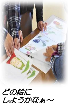
どの絵にしようかなあ～