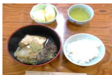
12月は《すき焼き》と美味しくいただきました