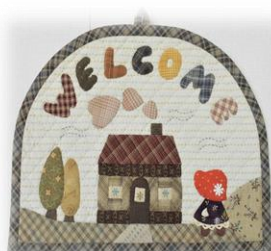
見本は公民館にあります