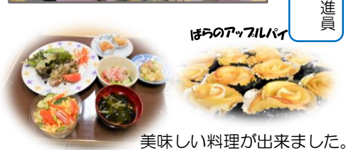
ぼらのアツアツパイ