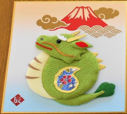
R5 10/26 自主団体講座(女性塾)で作製したものです。

人口:1,567 (-5) 世帯:773 (-2) 男性:758 (-2) 女性:809 (-3)