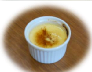
クリームブリュレ