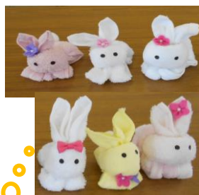
タオルでウサギを作りました