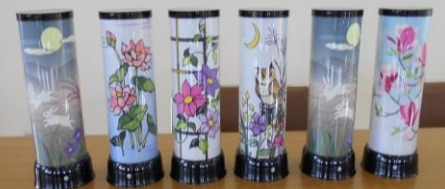
手作り広場 【LED あかりアート】