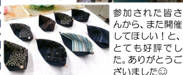
参加された皆さんから、また開催してほしい!と、とても好評でした。ありがとうございます◎

講座の申し込みは、土日祝日を除く8:30~17:15までに中央公民館へお願いします。