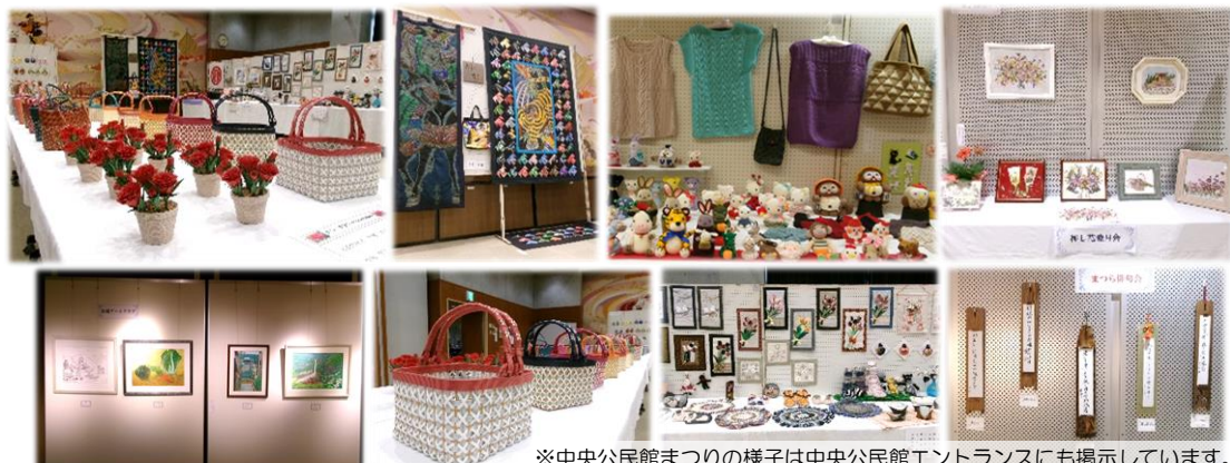
※中央公民館まつりの様子は中央公民館エントランスにも掲示しています。

中央公民館利用者団体連絡協議会主催・中央公民館共催のもと開催いたしました。2日間でのべ169人の方にご来場いただきました。ありがとうございます! プロ級の展示作品に、来場された皆さんとても感心されていたようです。設営、撤去時にご尽力いただきました協力団体の皆様に感謝申し上げます。