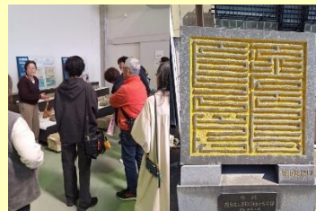
松浦市立埋蔵文化財センター

市では、世界的にも重要な遺跡と言われる「鷹島神崎遺跡」を中心とした鷹島の歴史を体験する学習会を行っています。今回はツアーに合わせ、体験での学びをさらに深める方法として、図書館や図書資料の利用について紹介を行いました。先人たちの足跡を巡るツアーには子どもから大人まで14名の参加があり、質問をするなど鷹島の歴史にどんどん惹き込まれていったようです。