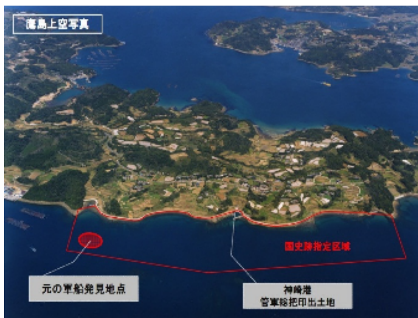
国指定史跡 鷹島神崎遺跡