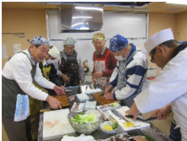
おやじ塾（中央公民館）