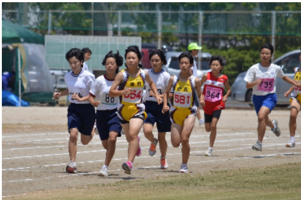
松浦市陸上選手権（松浦市民運動公園）