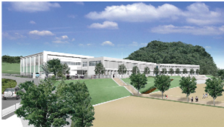
福島地区小・中学校完成予想図