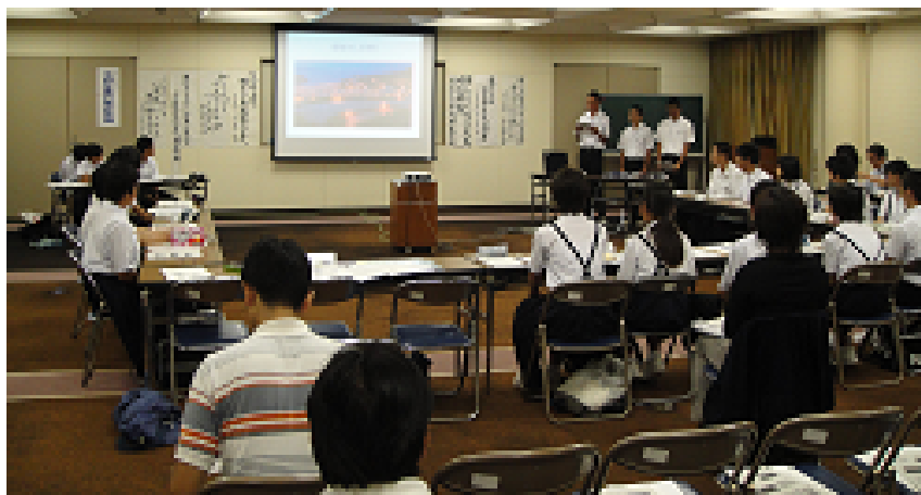
いじめ問題を話し合う「生徒代表者会議」