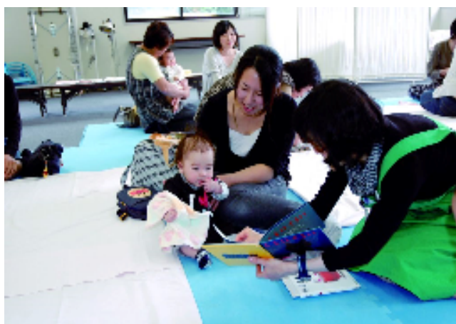
乳児健診時の読み聞かせサービス