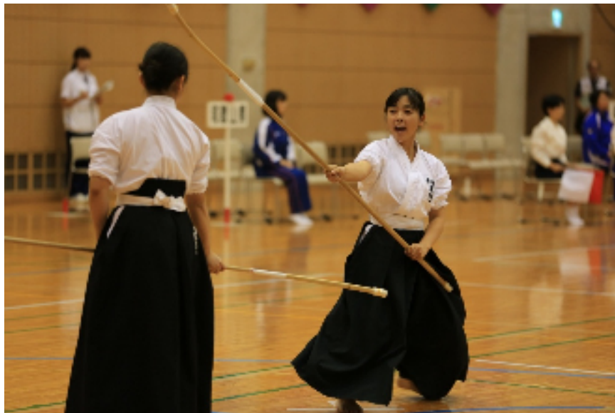
なぎなた演技競技（長崎がんばらんば国体）