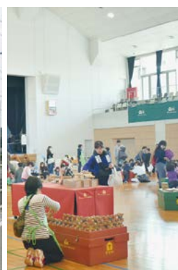
▲木育キャラバンの様子