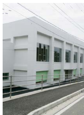
▲福島中学校 屋内運動場の外観