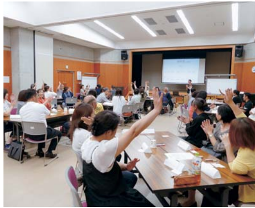
▲ PTA 連合会合同研修会