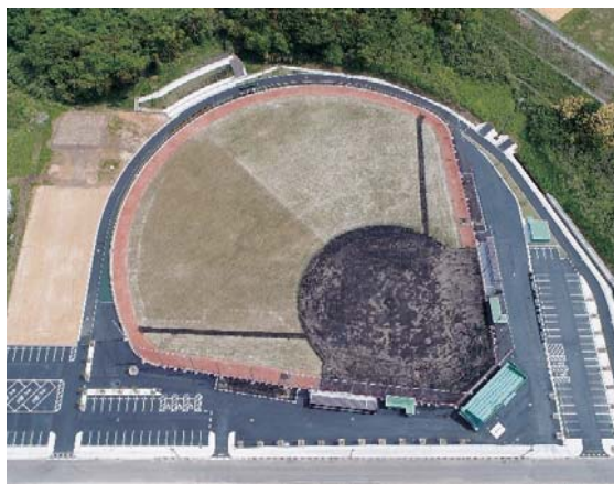
▲青のまち松浦スタジアム