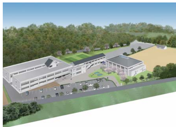
▲鷹島地区小中学校完成予想図