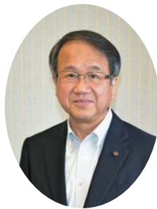
松浦市教育長 今西 誠司

教育は、人々の多様な個性・能力を開花させ、人生を豊かにするとともに、社会全体を発展させる基盤となるものです。