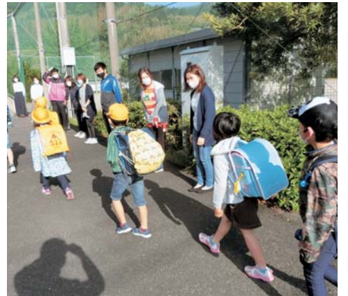
▲上志佐小学校挨拶運動