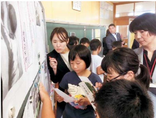
▲星鹿小学校研究授業