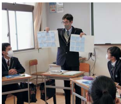
▲ 2学年のまつナビの様子

また、この取り組みを通して地域の魅力を発見し、「地域に残る」生徒や「将来松浦市に貢献したい」という生徒を育てることができると考えています。