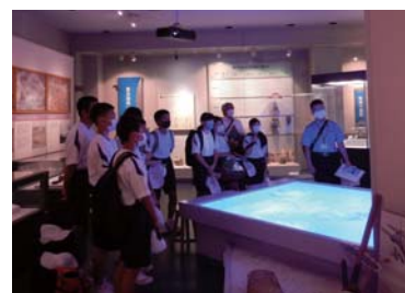
▲鷹島中学校1年生の様子

特に今福中学校は、事前学習として文化財課職員による出前講座を受講し、国史跡鷹島神崎遺跡やふるさとの「松浦党」発祥の地であることなどの説明を受けました。