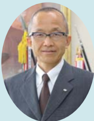
長崎県立松浦高等学校