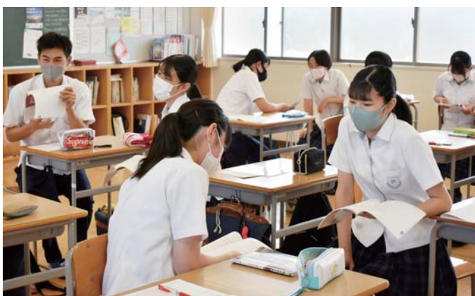
▲3学年の夏季補習の様子

松高は、令和4年度から「地域科学科」と「商業科」の2学科に変わります。これは、文部科学省の新時代に対応した高等学校教育に関する制度改正（令和3年）によるもので、普通科の学びに加えて、これからの社会の変化に対応するための学びを大学を含めた進学を最優先に考えた