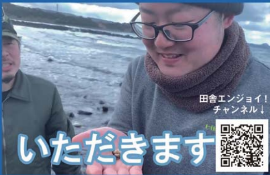
田舎エンジョイ！ チャンネル！