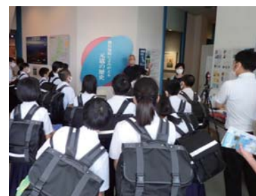
▲今福中学校1年生の様子