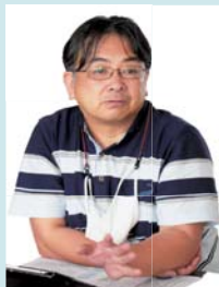
長崎大学教育学部

松高は、「シン化」する学舎 まちなびや です。「シン化」とは、次の①②③を実現することです。 ①「キャリアプランニング」に応じた「基礎的な学び」と「まつナビ」を「深める」こと。 ②社会の変化に対応できる「課題解決能力」と「ふるさとを大切にする姿勢」を「伸ばす」こと。 ③①で培った②の「力」を最大限活用して、松高生一人ひとりの 進路希望の実現を図ること 。 来年度から、地域科学科（シン化した普通科）では大学を含む進学を、商業科では松浦市内をはじめとする就職を目指した教育活動を進めます。松浦の子どもは、松浦で育てる。松高で、人生を豊かに生きていくための力を身に付ける。その理念の実現のため、松高の教育活動に対する、松浦市の皆さまのご理解とご協力を心からお願いいたします。