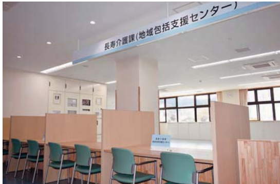
▶長寿介護課 地域包括支援センター