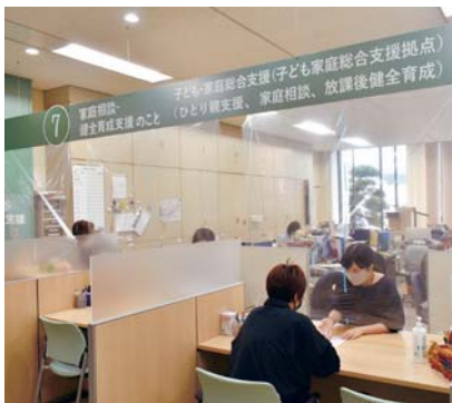
▲子育て・こども課

市民福祉総合プラザの1階へ移転した長寿介護課の後（本庁1階6番、7番窓口）に、福祉事務所内の子育て・こども課が移転しました。5月18日から、新窓口で業務を開始しています。