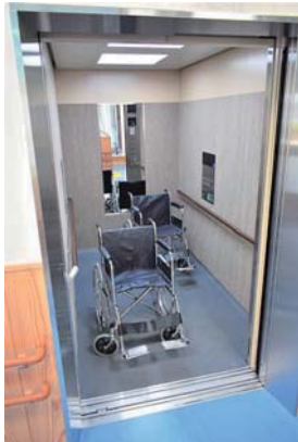
▶大きく作られたエレベーター

松浦市老人クラブ連合会事務局や、身体障害者福祉協会などの福祉団体が利用できるスペースも備えています。