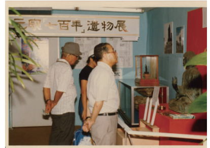
▲元寇七百年遺物展