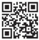
▲ポケットマルシェ