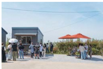
▲ 9/12 プレオープン！

店頭での販売がメインですが、地元松浦にたくさんの恩返しをしていきたいという想いから、ふるさと納税に参加しました。少量から自分のペースで始められるふるさと納税で、松浦の力になればと思います。