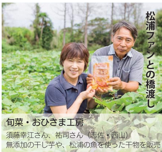
松浦ファンとの橋渡し