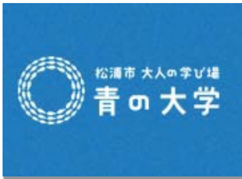
松浦市 大人の学び場「青の大学」