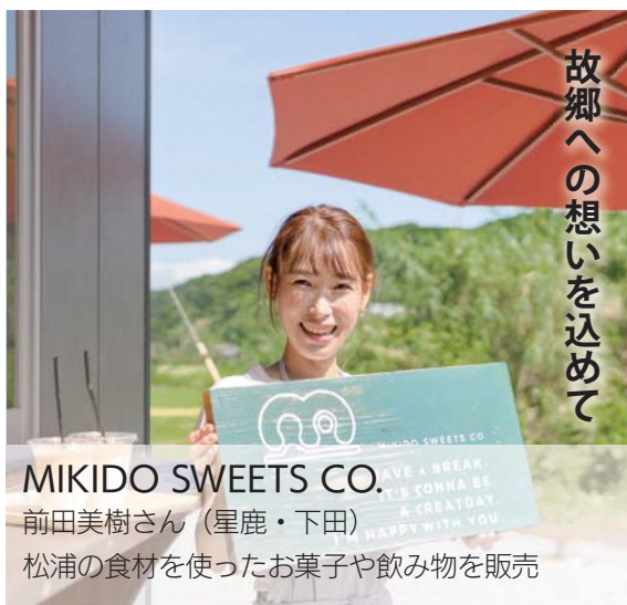
故郷への想いを込めて

夫婦2人の小さな工房ではありますが、小さいお子さんから、ご高齢の人まで安心して食べていただけるような商品づくりをモットーにこれからも頑張っていきたいと思えます。