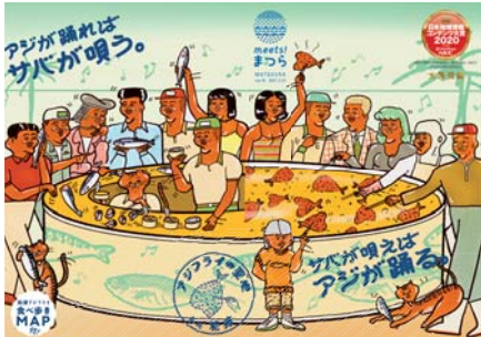
▲ meets! まつら 16号