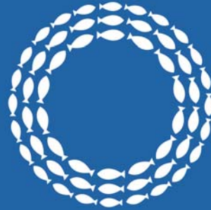
人の輪がつながり、ひろがるイメージを形にした青の大学ロゴマーク。