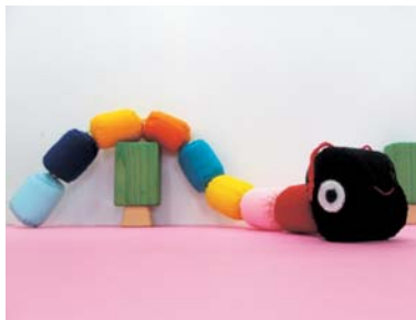
▲手づくりのおもちゃ

母子保健推進員は、親子の健やかな暮らしをお手伝いするため、市に登録された人たちです。子育て中の皆さんには、「母推 ぼすい さん」の略称で親しまれています。安心して妊娠・出産・育児がで