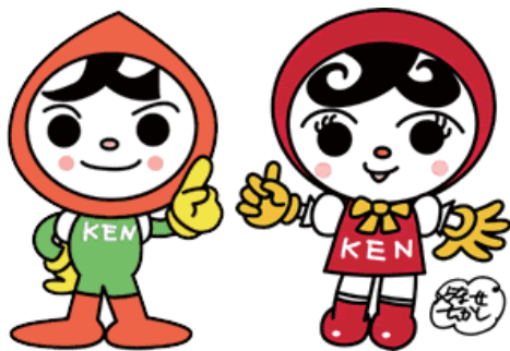
人権イメージキャラクター 人KENまもる君・人KENあゆみちゃん