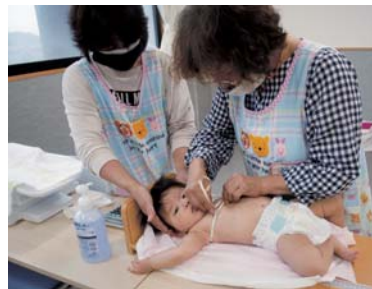
▲乳幼児健診での身体測定

きるよう、身近な相談役として、また行政とのパイプ役として、現在13人の推進員が活動しており、乳幼児健診の際にお子さんの身体測定を行ったり、保健師に同行して新生児や乳児のいる家庭を訪問したりしています。 また、子育て中のお母さんとその家族を対象としたおもちゃづくり教室を開催するなど、地域の子育て世帯を応援しています。