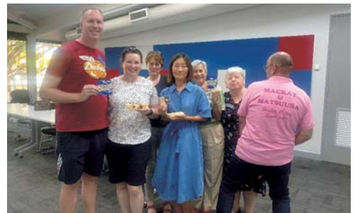
▲（上）動画を視聴している様子 （下）参加したマッカイ市の皆さん