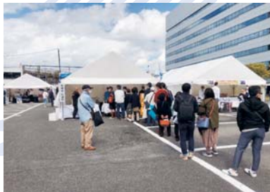
▲松浦ブースの様子