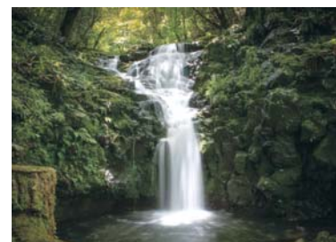
▲松浦の豊かな自然