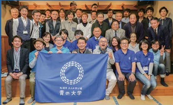
松浦を思う市内外の人が集まった青の大学主催イベントの様子。