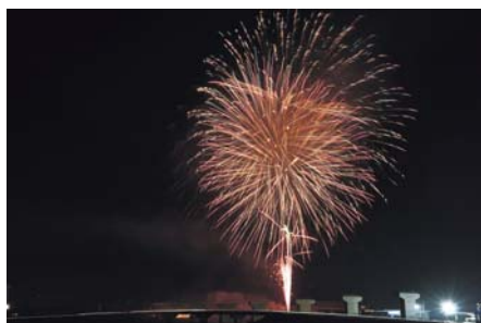
▲志佐町で打ち上げられた花火