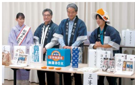
▲全体抽選会の様子