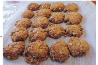
▲(上) ラミントン (下) アンザック・ビスケット